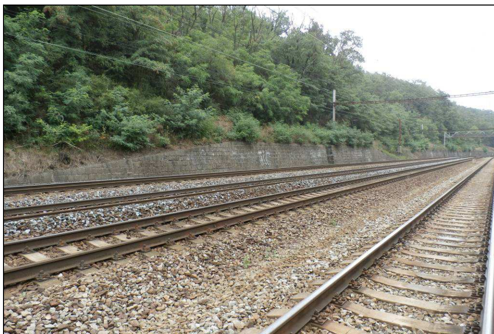
Obr. č. 7 - pohled na objekt zleva v km 7,850