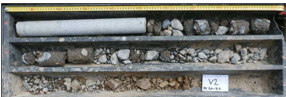
Obr. č. 3 - diagnostický vrt V2