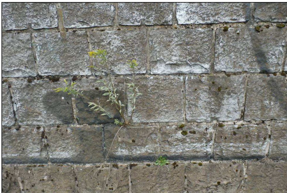
Obr. č. 10 - detail na spárování zárubní zdi - usazené náletové rostliny