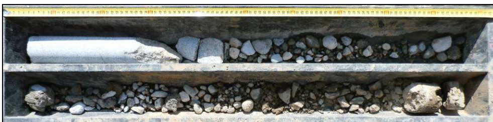
Obr. č. 1 - diagnostický vrt V1