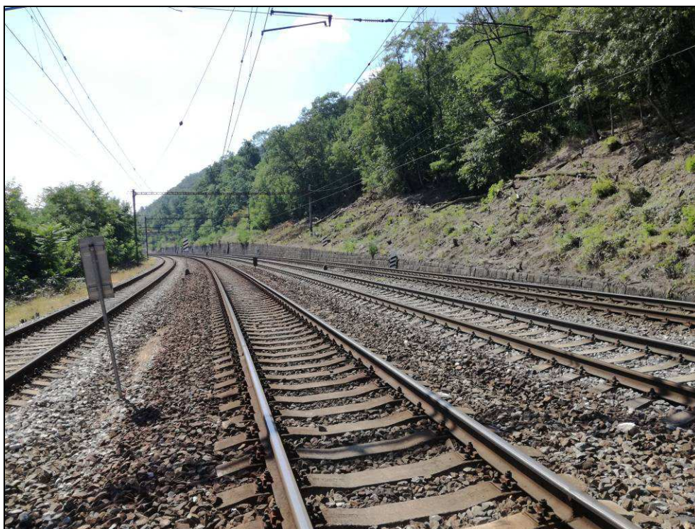
Obr. č. 11 - pohled na objekt zprava v km 7,4