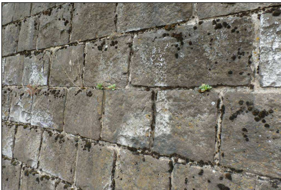
Obr. č. 11 - detail spárování zárubní zdi - usazené náletové rostliny