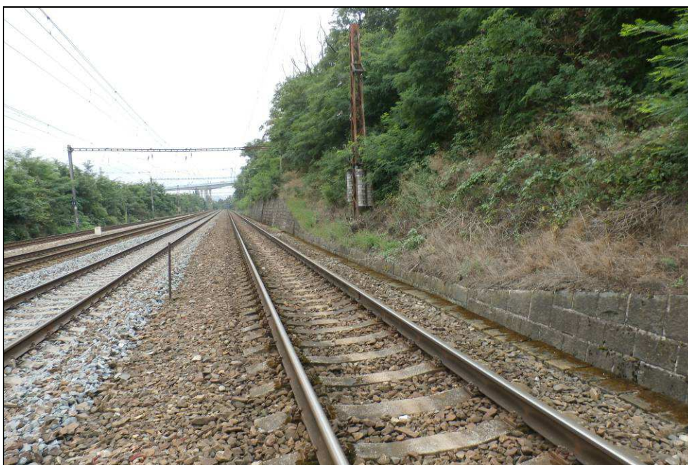
Obr. č. 8 - pohled na objekt zprava v km 7,740