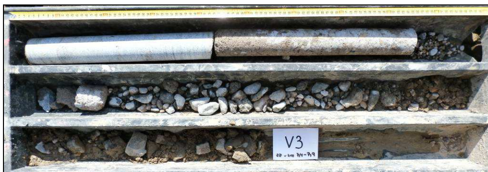
Obr. č. 5 - diagnostický vrt V3