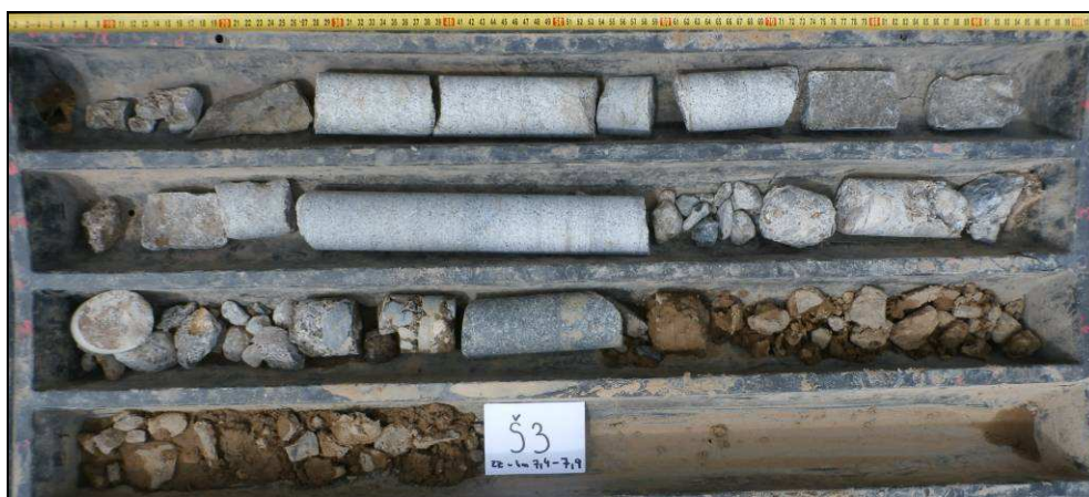
Obr. č. 6 - diagnostický vrt Š3