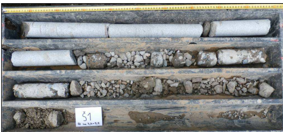
Obr. č. 2 - diagnostický vrt Š1