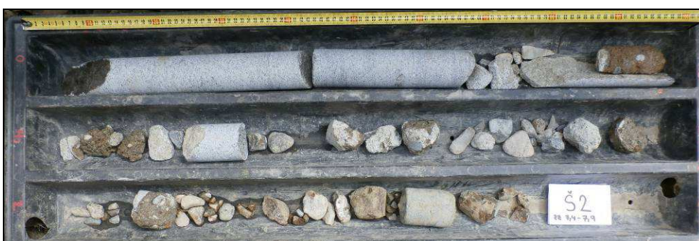
Obr. č. 4 - diagnostický vrt Š2