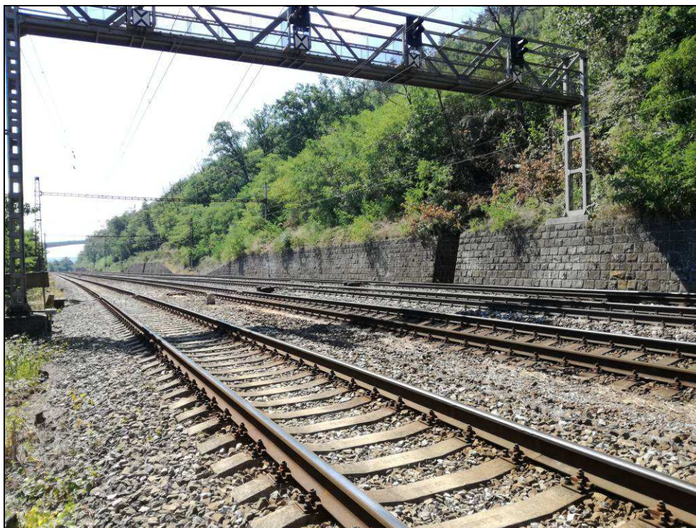
Obr. č. 10 - pohled na objekt zprava v km 7,650