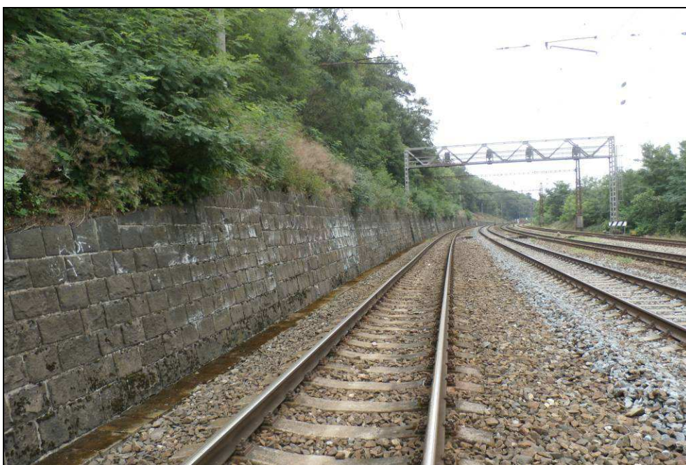
Obr. č. 9 - pohled na objekt zleva v km 7,740